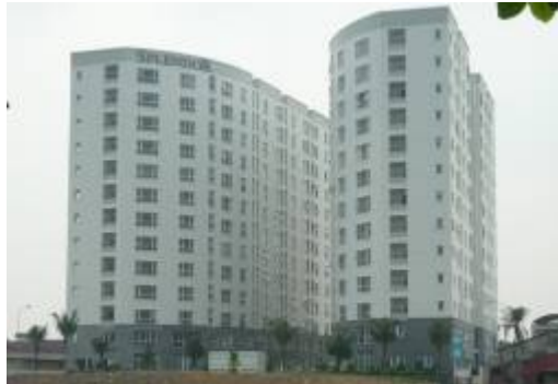
Hình phối cảnh Chung Cư Splendor Gò Vấp

Căn hộ tọa lạc tại mặt tiền đường Nguyễn Văn Dung, giáp mặt tiền sông Bến Cát. Đây là điểm kết nối giao thông thuận lợi đến trung tâm các quận, sân bay quốc tế Tân Sơn Nhất, khu công viên Phần mềm Quang Trung, gần với hệ thống đường giao thông Xuyên Á đi các tỉnh Bình Dương, Đồng Nai và các tỉnh miền Tây.